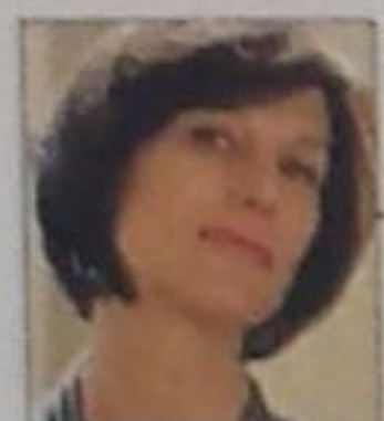
di LETIZIA CINI

GLI UOMINI vogliono essere belli: barba curata e fisico scolpito. A volte palestra, alimentazione e un corretto stile di vita sembrano non bastare. E allora si ricorre alla tecnologia. Ne parliamo al termine del congresso di Aicpe (Associazione italiana chirurgia plastica estetica) svoltosi a Firenze, con Kai-Uwe Schlaudraff, specialista di chirurgia plastica estetica a Ginevra, uno dei primi in Europa a ricorrere, dieci anni fa, agli ultrasuoni di terza generazione.